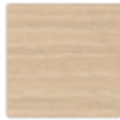
Chêne de Fil Naturel